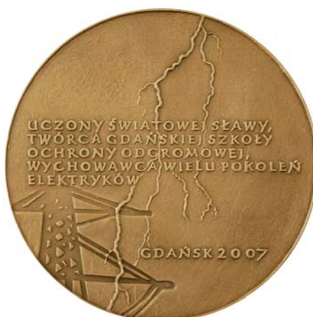
Awers i rewers Medalu